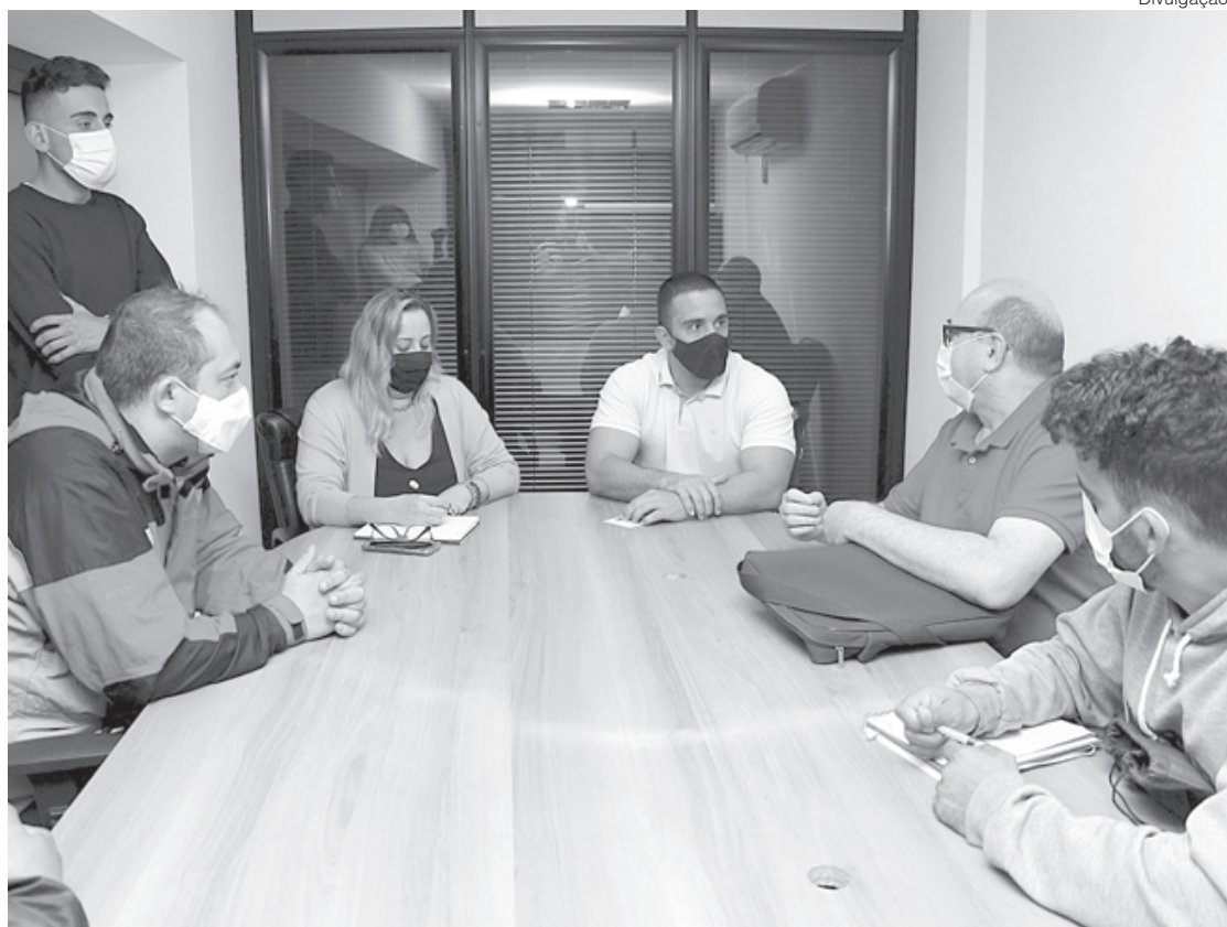
Programa vai mapear pontos turísticos da região do Vale do Café

Uma fazenda onde se cria búfalos e faz leite de búfalos, uma horta onde o produtor planta e vive daquilo, e está aberta para receber visitantes para viver essa experiência. O turismo rural é a experiência, então nós queremos