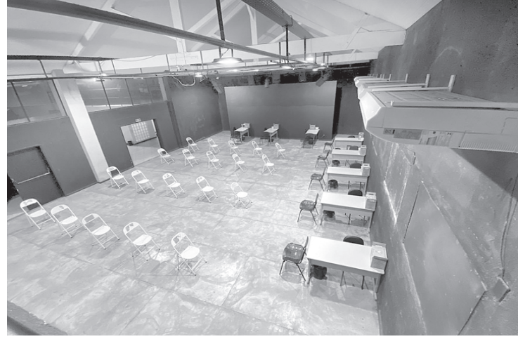
Período de três meses é fundamental para o meio ambiente e a sustentabilidade da pesca extrativista

O defeso do camarão é regulamentado pela Instrução Normativa do Ibama nº 189, de 23 de setembro de 2008. O desrespeito ao