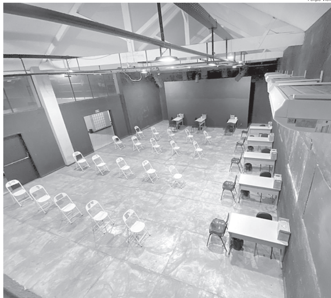
Nova estrutura será focada para aplicação das doses da Pfizer no Parque da Cidade

É um espaço que vai permitir que façamos o atendimento com qualidade às pessoas que venham a tomar a vacina da Pfizer. Eu peço desculpas pela semana passada termos tido problemas, mas é a vontade de vacinarmos sempre. Muita cidade abriu mão de utilizar essa vacina pela dificuldade, mas nós entendemos que aqui em Barra Mansa cada vacina é fundamental e importante para salvar - comentou o prefeito Rodrigo Drable.