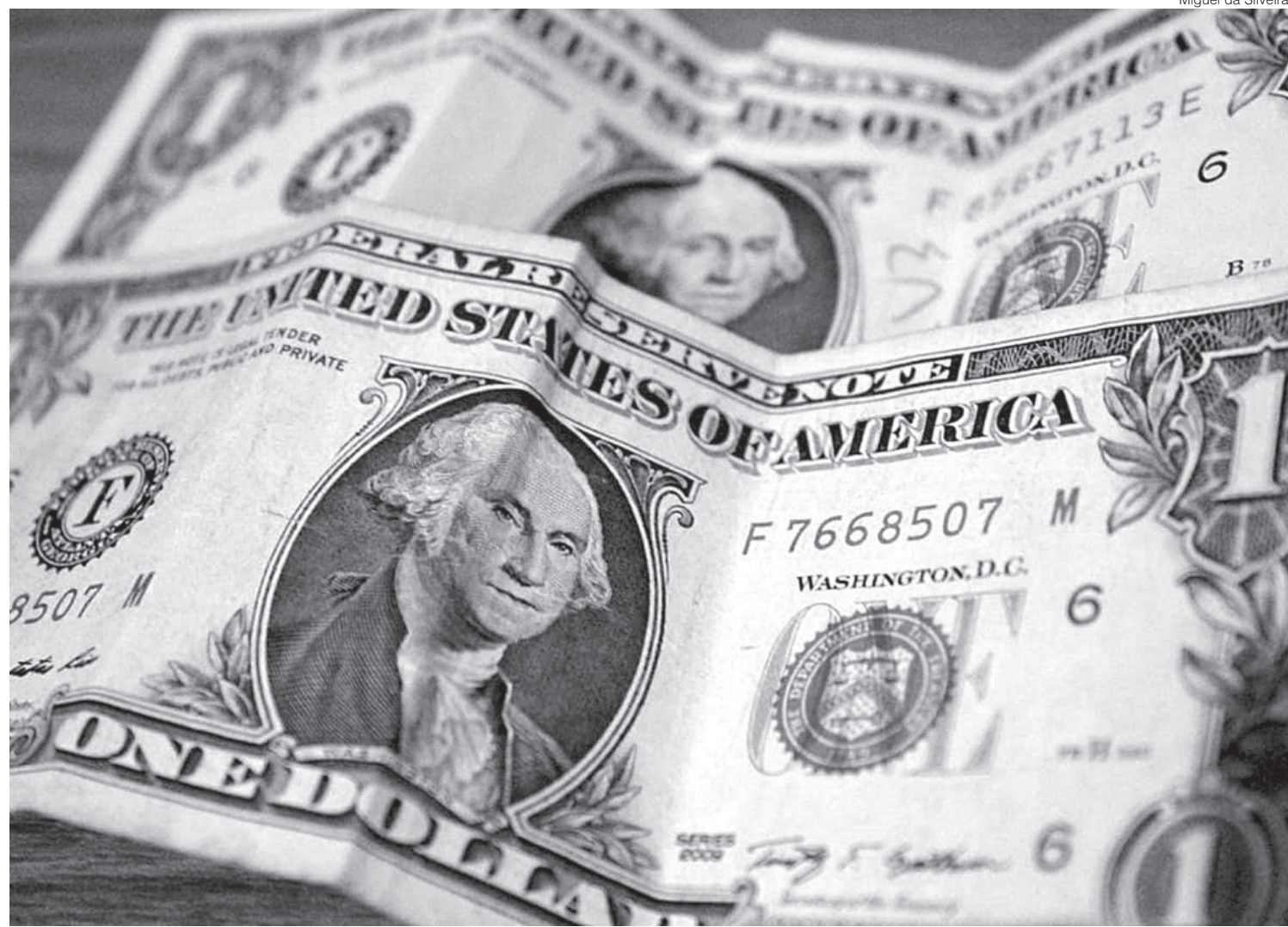
No fechamento de ontem, terminou em alta de 0,25%, a R$ 5,2249

Nos negócios do período da tarde, as mesas de câmbio monitoraram participação do presidente do Banco Central, Roberto Campos Neto, em eventos. O dirigente declarou que a atividade tem mostrado força e já há previsão de PIB crescendo acima de 4% este ano. Ele, contudo, enfatizou que a situação de endividamento do Brasil é "bastante frágil", por conta dos gastos com a pandemia, e reforçou a necessidade de o Brasil atrair mais investimento estrangeiro. "Estamos vendo recuperação extraordinária da economia."