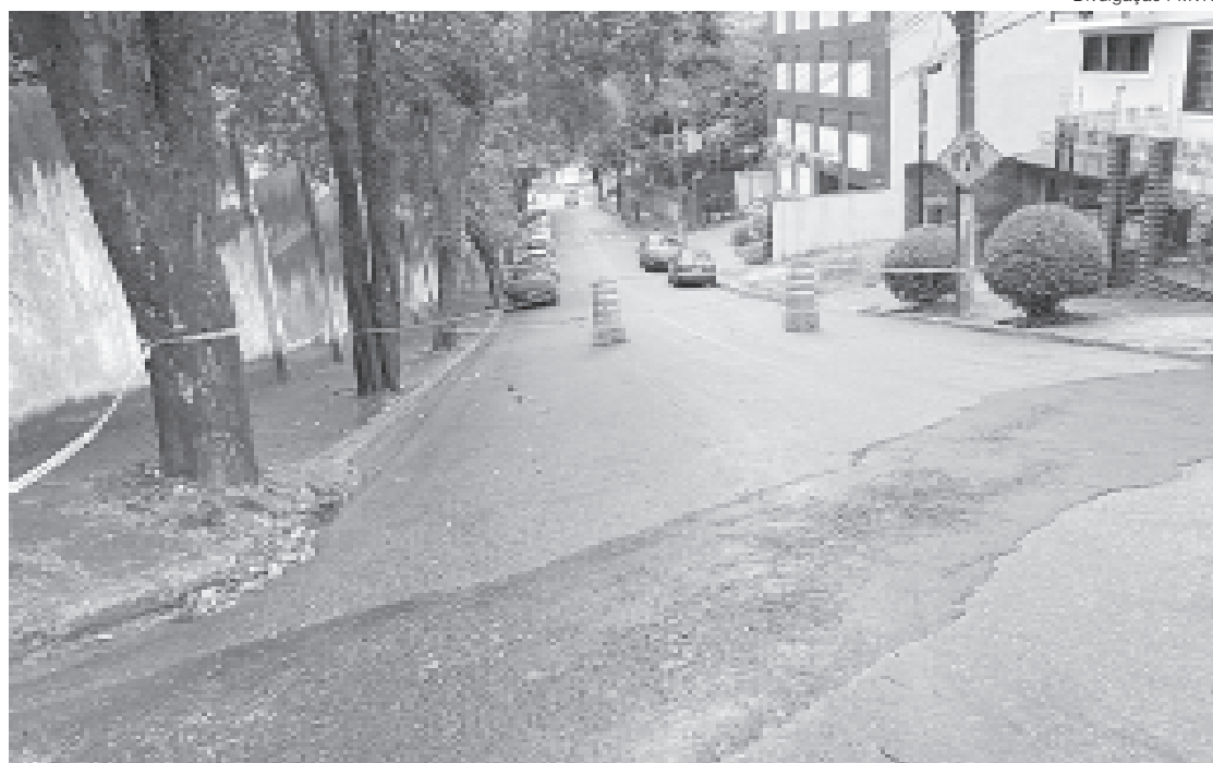
Só nessa segunda-feira (31), foram registrados 10,6 mm até as 9h