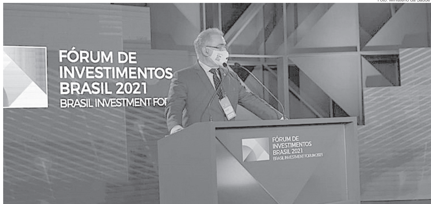
Segundo Queiroga, Brasil atingiu em maio a meta de 10% da população completamente imunizada

- São recursos que permitiram aumentar transferências federais a estados e municípios para aumentar a capacidade de leitos de UTI, comprar insumos es-