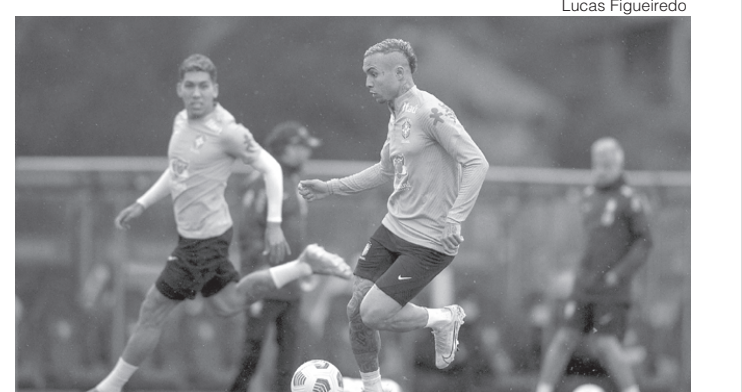
Elenco trabalhou situações de jogo para o duelo da próxima sexta-feira

Todos os jogadores que já se apresentaram à Seleção Brasileira foram ao campo 1