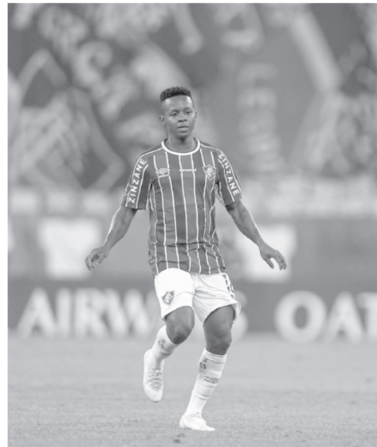
Meia do Fluminense vai defender a seleção de seu país em jogos das Eliminatórias para a Copa do Mundo de 2022

Além do confronto diante do time de Bragança Paulista, Cazares não estará à disposição do Fluminense para a partida contra o Cuiabá, pela segunda rodada do Campeonato