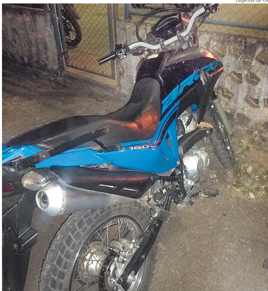
Uma das motos apreendidas pela Guarda Municipal após pega de motos