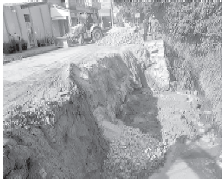
As obras emergenciais estão sendo realizadas no entorno do Córrego Cafuá, e a previsão é que fique pronto em 30 dias