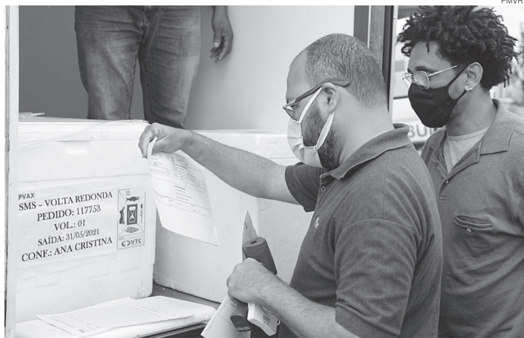
Cinco unidades de saúde realização imunização das vacinas nesta terça-feira

A imunização ocorrerá nas Unidades de Saúde (UBS e UBSF), de 08h às 16h, exceto nas unidades dos bairros: 249, Siderlândia, São João, Vila Mury e Volta Grande.