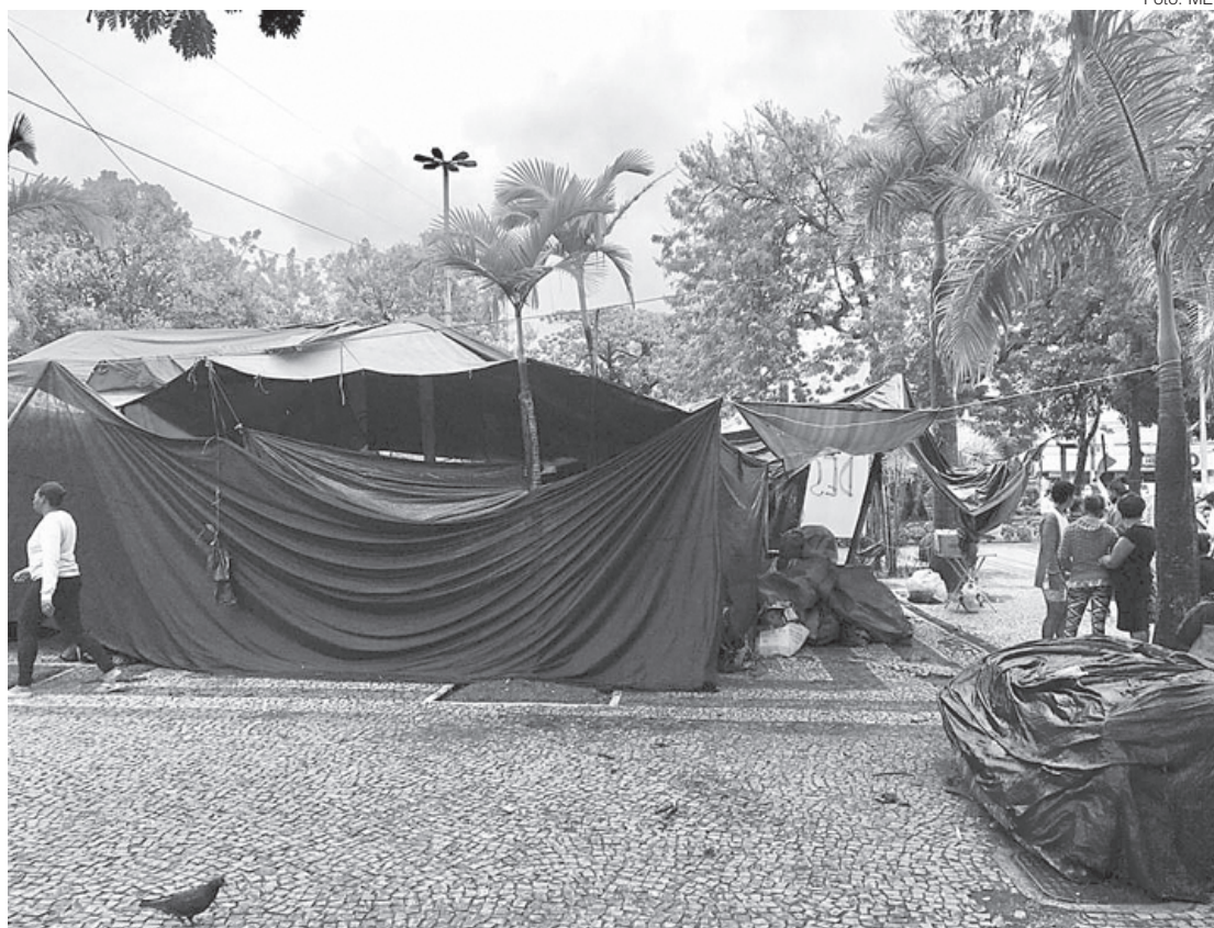
Manifestantes permaneceram acampados em frente à Prefeitura de Volta Redonda, apesar da chuva

A ocupação começou em janeiro deste ano, e, embora haja 868 famílias cadas-