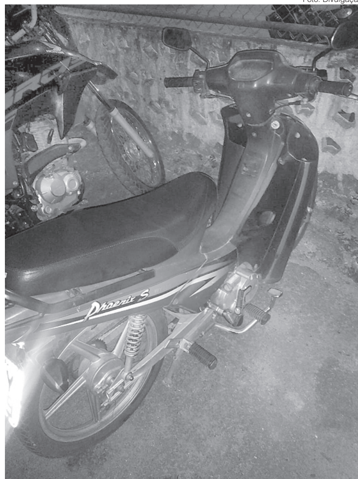
Duas motos foram apreendidas para o depósito municipal ainda na madrugada de domingo